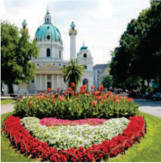
Karlskirche in Wien