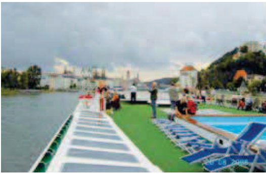
Sonnendeck mit Pool