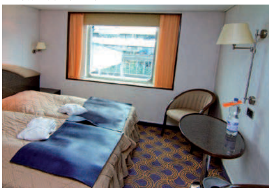
2-Bett-Kabine außen mit Fenster