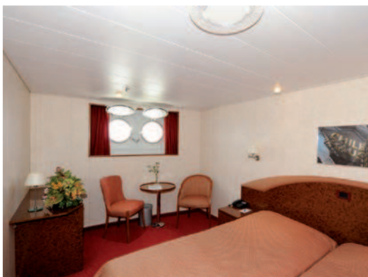
2-Bett-Kabine außen mit Bullauge